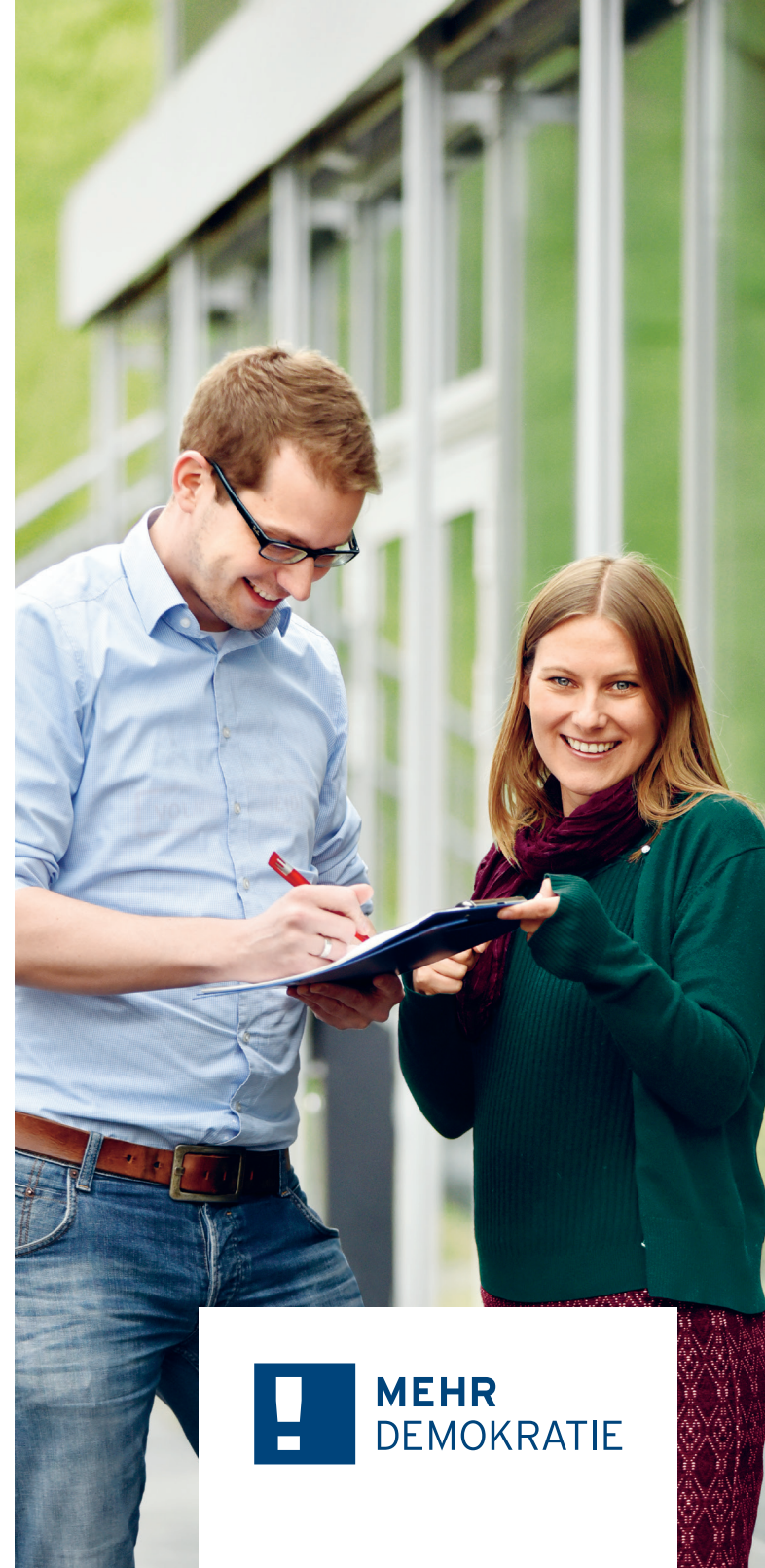
Redaktion & Lektorat: Anne Dämmer, Alime Koeppien, Konzeption & Gestaltung: www.ilanehaug.de; Foto: Michael von der Lohe

Spendenkonto DE14 7002 0500 0008 858105 Bank für Sozialwirtschaft